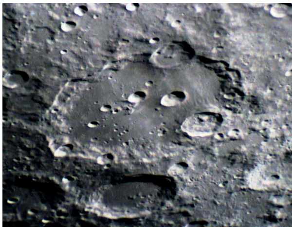
↑ Il cratere Clavius ripreso con una ToupCam 1200 .