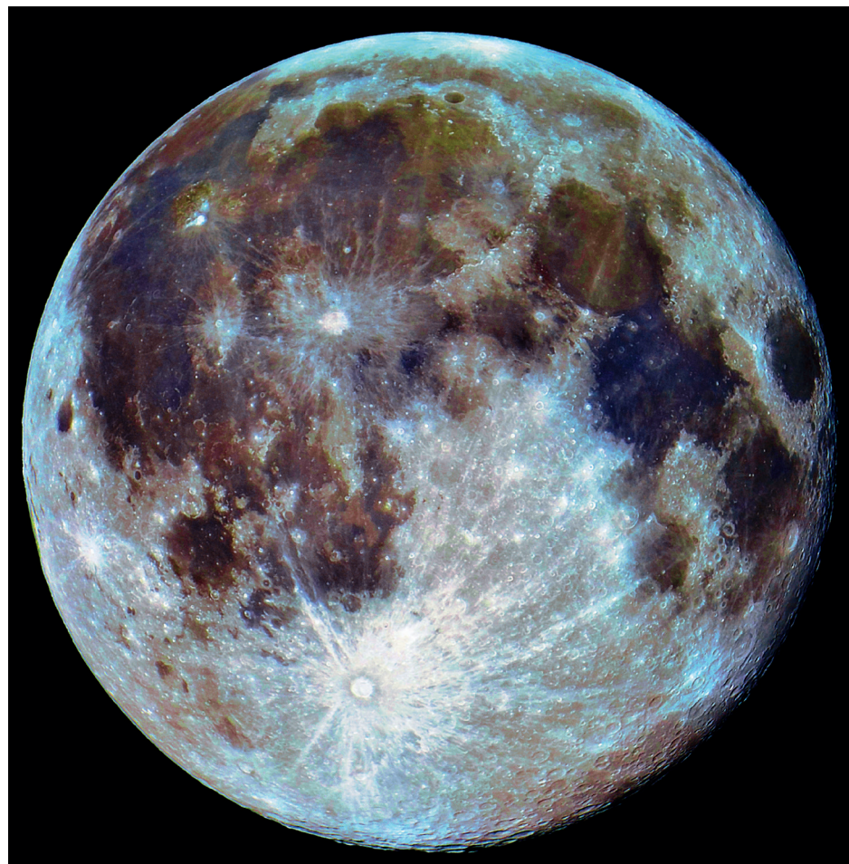
↑ Luna ripresa in afocale nel Mak 152 con una digicam Kodak C183.