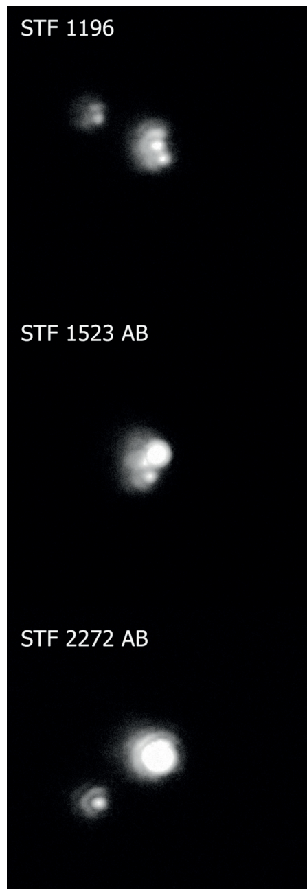
↑ Una selezione di stelle doppie riprese mediante il Mak 152 e la camera ToupCam da 1,2 MP.