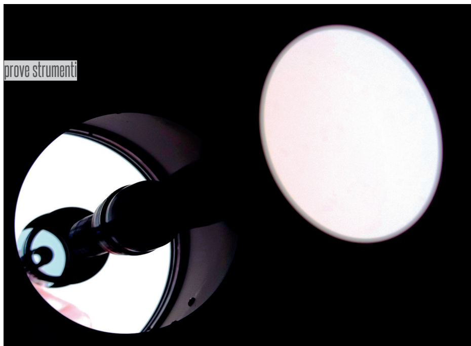
↑ Visione dell'interno del tubo che mostra la buona opacizzazione e il paraluce interno.

↳ dio. La curvatura diventa meno evidente passando a poteri maggiori, raggiungendo una notevole ricchezza di dettaglio.