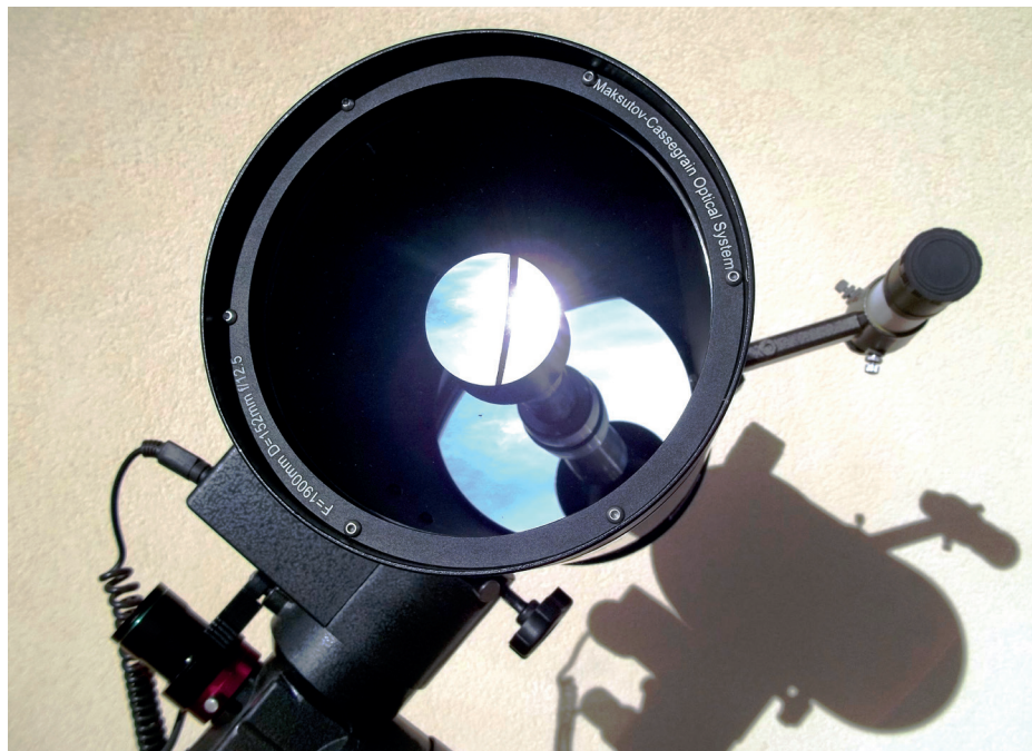
↑ Una ripresa frontale del Mak 152.

L'ottica è in configurazione Maksutov-Cassegrain, più volte trattata in queste pagine. Ricordiamo soltanto che tutte le superfici sono sferiche, quindi molto più facili da lavorare, con il secondario ricavato alluminando una parte del menisco concavo nel lato rivolto verso lo specchio forato al